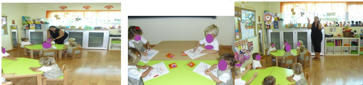
Sesión de "Buenos días"

El ambiente positivo y afectivo en clase fomenta el aprendizaje significativo de los niños