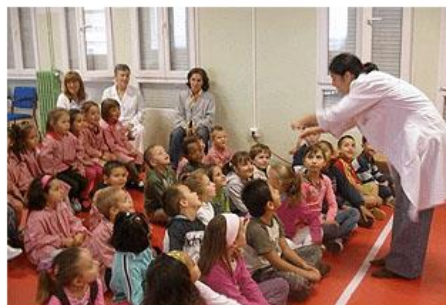
Muy atentos a las explicaciones de la monitora.

El colegio Quinta Porrúa de Santander ha comenzado a impartir los talleres del Proyecto 'Yo quiero ser científico', subvencionados por la Consejería de Educación y coordinados por la Asociación de Madres y Padres del centro.