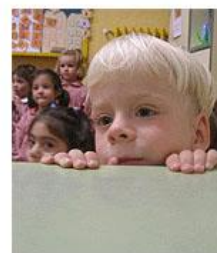
'El conejo blanco' llega al CP Quinta Porrúa

Entre otros objetivos, este proyecto pretende desarrollar la curiosidad e imaginación de los jóvenes para que descubran por sí mismos la gran importancia que tienen para su formación personal la ciencia, la salud y el medio ambiente, presentándoselas como algo muy cercano a sus actividades cotidianas, de una manera amena y participativa.