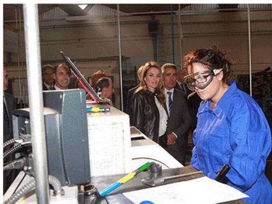
Doña Letizia se interesó por las alumnas de sectores tradicionalmente masculinos.

El pasado 8 de octubre tuvo lugar la apertura oficial del curso de Formación Profesional en nuestro centro. La Princesa de Asturias presidió el acto junto al ministro de Educación José Ignacio Wert.