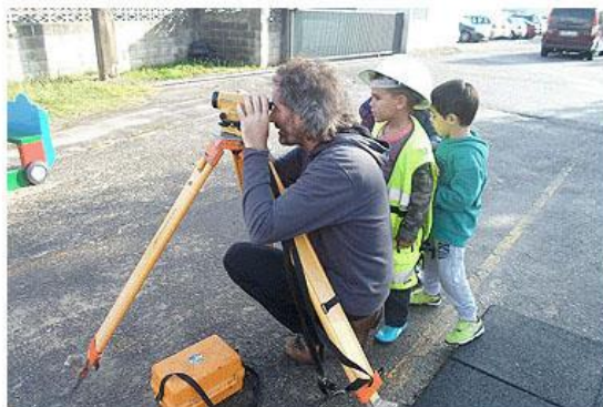
Aprendimos un montón.

Los escolares de Educación Infantil del CEIP Quirós descubren encantados las profesiones, algunas no tan conocidas como la de topógrafo.