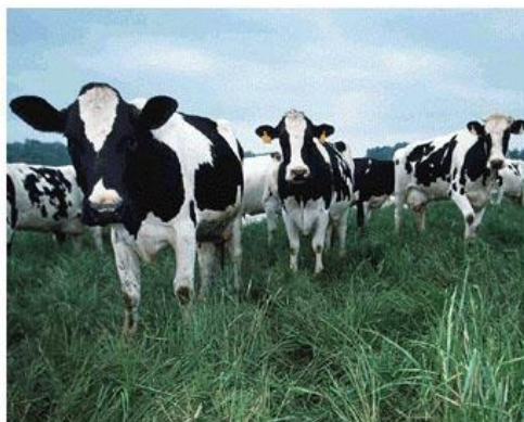
Las frisonas son las vacas que más abundan en Cantabria.