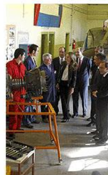
Inauguración del curso de FP 2013-2014