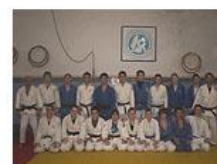
Judo Club La Salle

Además de conocer mejor una profesión, nos dimos cuenta de que la sociedad no es siempre como nosotros pensamos y que la gente o los clientes unas veces puede tratarte mejor y otras no, pero eso no nos hizo perder las ganas. Así aprendimos el comportamiento que debemos tener en el mundo laboral, nuestras acciones, nuestra forma de comunicarnos y todos los papeles que tenemos que rellenar.