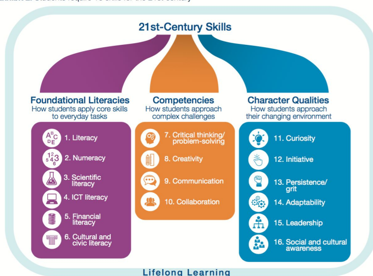
Exhibit 2: Students require 16 skills for the 21st century

Asimismo, empleamos la metodología Design Thinking para el desarrollo de proyectos dentro del viaje de aprendizaje que realizamos.